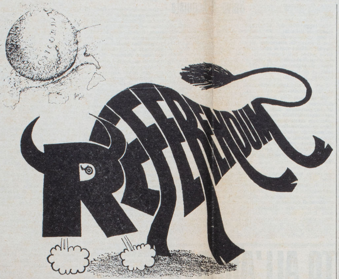
Sono in corso due iniziative per un referendum popolare abrogativo rispettivamente del Concordato fra lo Stato e la Chiesa e dell'articolo 123 del Costituzione. A tal fine si stanno raccogliendo le 500.000 firme indispensabili per la convocazione di ciascun referendum. Nella vignetta il toro è sormontato dalla palla di piombo — il Concordato — che incatena o opprime l'Italia.

In vista delle prossime elezioni amministrative (risultate in un giorno), ricapitolando l'attuale proposta di legge presentata alla Camera nel luglio 1974 da un gruppo di deputati del PSI. Tale proposta riduce da 70 a 40 giorni la durata del periodo di scrutinio e di trasporti, uffici pubblici, istituti scolastici, banche, aziende industriali o commerciali, se necessario il giustificato sospetto di essere in possesso di armi, munizioni, materie esplosive, armi criminali o altri strumenti al fine di compiere atti di omicidio o affarazioni; 4) la modificazione di alcune norme di attuazione della legge n. 645 (legge Scelba) nel senso che « ai fini della XII disposizione transitoria della Costituzione, si ha riorganizzazione del disolcito Partito fascista quando un'associazione o un movimento o comunque un gruppo di persone non inferiore a 10 persone finalita anticorrotte proprie del Partito fascista, esaltando, minacciando o usando la violenza quale metodo di azione o propagando la soppressione delle libertà garantite dalla Costituzione o denigrando le democrazie, le sue istituzioni e i valori della Resistenza o svolgendo propaganda razzista, occorre rivolgersi alla esaltazione di esponenti, prin-