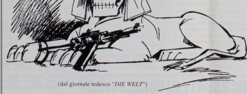
(dal giornale tedesco "DIE WELT")

no le funzioni su aggiornate professionali, trasferimenti, promozioni dei giudici ordinari, dei PM e dei magistrati amministrativi.