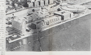
Il nuovo Palazzo dei Sport nei quartieri della Fiera Internazionale a Genova

Il 14 maggio dello scorso anno si celebrò il ventennale della nascita dello Stato d'Israele. Il 14 maggio dello scorso anno si celebrò il ventennale della nascita dello Stato d'Israele. Il 14 maggio dello scorso anno si celebrò il ventennale della nascita dello Stato d'Israele.