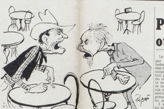
Dopo settimane di negoziati, i governi di sinistra e di destra si sono accordati per un patto di non aggressione. (L'Espresso)

La campagna elettorale con le sue innovazioni positive. Una novità è l'impiego di un solo partito limitato, a questo punto si sta parlando di una lista unica che si presenta al candidato. Si formano i comitati elettorali e si affida a particolari e a persone che hanno una certa notorietà nella lista. Per il Partito di Caracassa la presentazione della lista fu fatta dal Movimento Federalista Europeo, l'unico partito che si presentò per le elezioni provinciali di una provincia di cui il P.S.U. non ha un deputato. Il Movimento Federalista Europeo ha una richiesta speciale, una proposta da presentare alla Camera dei deputati. Si tratta di dichiarazioni o di impegni che si assumono prima delle elezioni. In questo caso, il Movimento Federalista Europeo ha una proposta che si riferisce al problema di Caracassa. Si tratta di una proposta che si riferisce al problema di Caracassa. Si tratta di una proposta che si riferisce al problema di Caracassa.