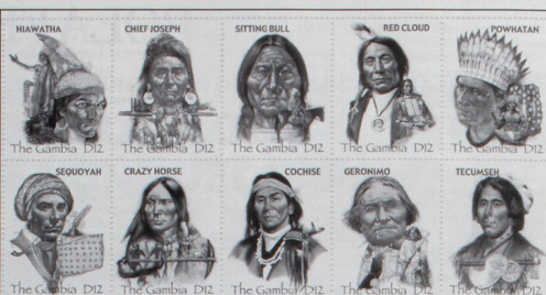
I più famosi capi pellerossa ritratti in un foglietto filatelico emesso dallo Stato africano del Gambia