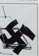
SAVOIA E LA STORIA

Contro il mito nazional-popolare della monarchia savoiarda, oggetto di speculazioni politiche. Progetti in fase avanzata di studio di fattibilità esistono in Ciudad e in Colombia, mentre i progetti di intervento (rispetto alle quali PBI ha già fornito un certo numero di servizi) sono arrivate da vari altri Paesi, tra cui Cambogia, Georgia, Bosnia, Azerbaigian, Ucraina, Irlanda del Nord, Palestina. Ad Haiti le PBI stanno operando nel coordinamento di "Co Justice Nonviolent Presence" con l'aiuto di organizzazioni, mentre in Croazia collaborano al "Balkan Peace Team".