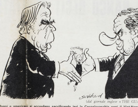
Russi e americani si accordano sacrificando lei la Coscevolocchia ogni il Vietnam del Nord

Il 22 maggio Ceylon è diventata una repubblica socialista. Il 22 maggio Ceylon è diventata una repubblica socialista. Il 22 maggio Ceylon è diventata una repubblica socialista. Il 22 maggio Ceylon è diventata una repubblica socialista. Il 22 maggio Ceylon è diventata una repubblica socialista.