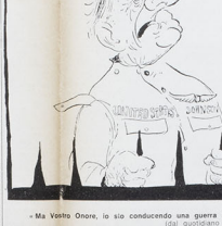
Ma Volto Onore, le sto conducendo una guerra e difesa della patria.