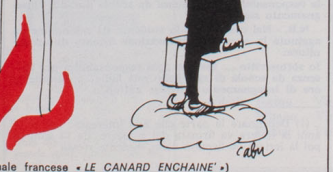
(dal settimanale francese « LE CANARD ENCHAINE »)

La moglie Raissa è andata a visitare una « tipica famiglia tedesca » in un quartiere popolare di Stoccarda, da lei raggiunto sotto una pioggia di fiori. I figli della coppia tedesca le hanno offerto i cibi tipici del Sud germanico. Si è parlato delle condizioni di vita di una famiglia nella RFT e nell'URSS. Poi l'ospite confermato la disponibilità