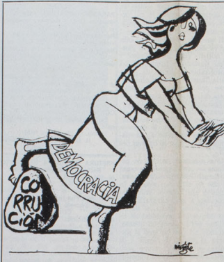
Non soltanto in Cina dilaga la corruzione, che è una pietra d'inciampo al cammino della democrazia come dimostra questa vignetta pubblicata dal quotidiano A.B.C. di Madrid.

Gli studenti, ma poi anche giovani operai ed impiegati, che da maggio avevano occupato la piazza Tien-An-Men di Pechino, prima in decimila, poi in centomila, poi in un milione per manifestare la loro sete di libertà e la loro ostilità alla corruzione, sono stati vittime di una repressione sanguinaria che ha fatto morire il mondo intero.