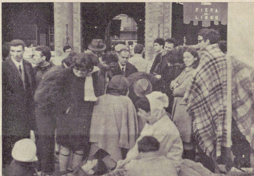
I dimostranti bolognesi, dopo la notte trascorsa all'addiaccio, attornati da una folla di cittadini

Quanto alle discussioni con il pubblico abbiamo sperimentato come sia difficile ragionare fuori degli schemi fissi dei blocchi di potenze e delle situazioni politiche e so-