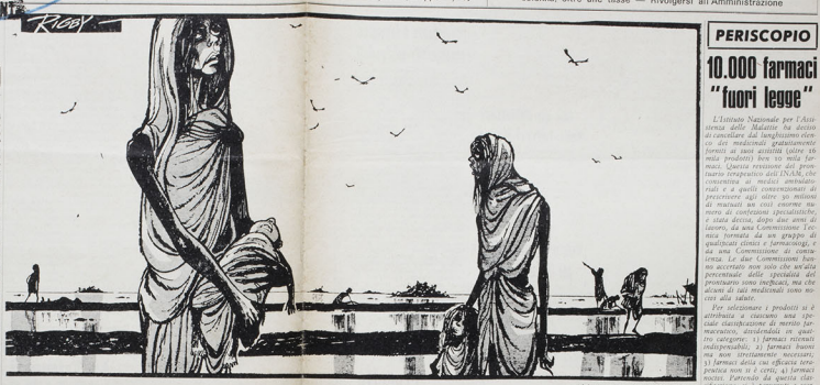
Secondo i dati ufficialmente forniti dal governo degli Stati Uniti e le notizie raccolte da due ricercatori americani che sono di ritorno colti da una settimana di voli di ricognizione aerea sopra il Vietnam del Sud, circa 100.000 persone sono state uccise da bombardamenti USA. In 1971 sono stati uccisi 100.000 vietnamiti. In 1972 sono stati uccisi 100.000 vietnamiti. In 1973 sono stati uccisi 100.000 vietnamiti.

Il prof. Leo Nakson, un professore di filosofia all'università di Mosca, ha scritto una lettera a Breznev in cui esprime il suo dissenso per le violazioni dei diritti civili in Cecoslovacchia e in Polonia.