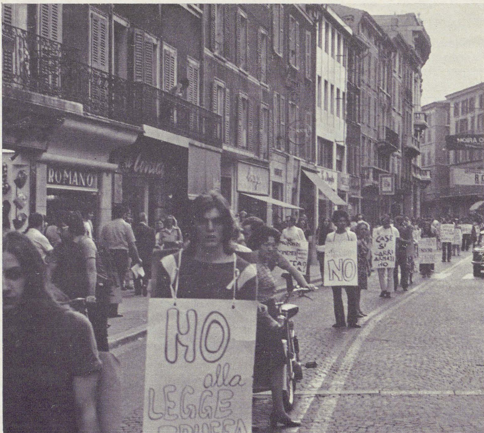
BRESCIA, 16 GIUGNO. Un particolare del corteo del Movimento Nonviolento che è sfilato per due ore per le vie della città.

In questo periodo non ho potuto che constatare di persona, di fronte all'enorme impiego di capitale materiale e persone per una istituzione come l'esercito contraria come nessun'altra alla realizzazione di una società civile e alla pacifica convivenza, l'assurdità dell'emarginazione e dell'abbandono a cui viene condannato chi più di ogni altro ha bisogno di aiuto per vivere