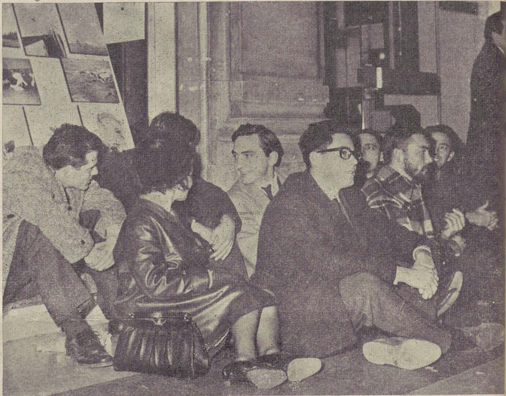
A Roma, per la sollecita discussione della legge per l'obiezione di coscienza - I dimostranti, in mancanza di comprovati motivi, si sono rifiutati di desistere dalla manifestazione e di seguire i poliziotti al commissariato, e attendono di venirvi portati a forza

A un certo punto infatti del colloquio, quando quel funzionario non sapeva più come rispondere alle nostre precise contestazioni (turbamento dell'ordine pubblico? ma le nostre manifestazioni, ormai numerose e prodottesi nelle principali città italiane, tra cui un anno prima nella stessa