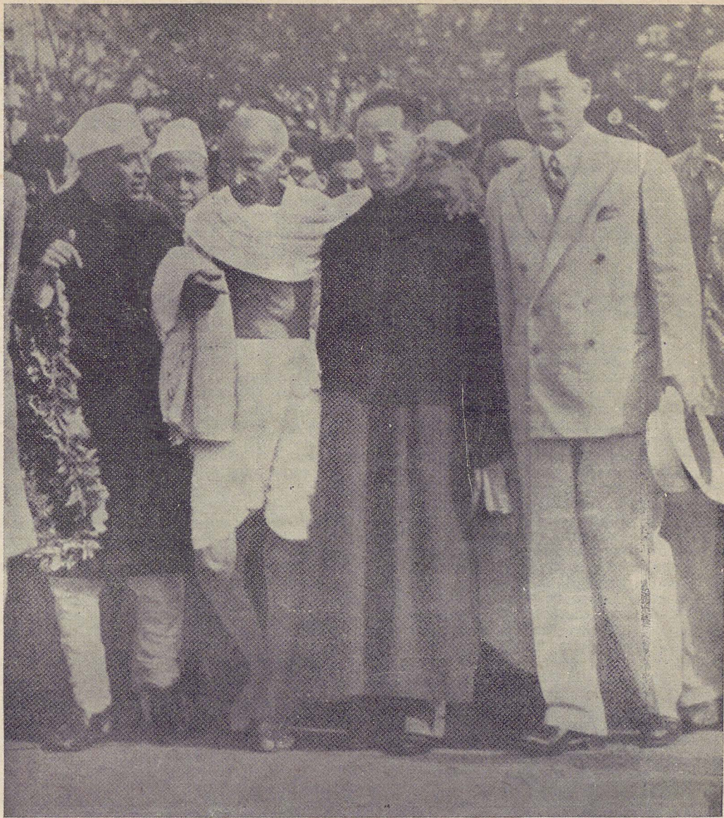
Gandhi con alcuni dei partecipanti alla Conferenza di Delhi per le relazioni di tutti i popoli asiatici, del marzo 1947.

Come abbiamo detto, quando l'assalitore vede il suo avversario reagire pacificamente, esso resta moralmente disarmato. Poiché persino l'uomo violento si trova moralmente giustificato della sua condotta brutale se gli si rende colpo per colpo. Diversamente, egli resta sconcertato e perde tutta la fiducia in sé. Il partigiano della nonviolenza non lo lascia nell'imbarazzo. Con l'aiuto della sua generosità, della sua benevolenza e della sua accettazione di soffrire,