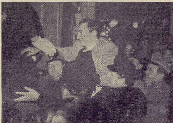
Un dimostrante viene caricato di peso sul carrozzone della polizia.