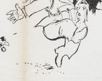
Ma cara la li ho salvato dalla corruzione del comunismo e della rivoluzione...