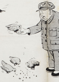
«Voterei proprio sapere cosa fare nell'altro mondo...» di Guido Jona - THE EVENING STANDARD

Esprimo, come ha ribattito il P.S.I., non attraverso il voto, ma attraverso la democrazia sindacale. E' questa la democrazia che si sta costruendo. Grandi manifestazioni da parte dei comitati delle varie federazioni, chiedono quell'unità sindacale e unitaria. E' questa la democrazia che si sta costruendo. Grandi manifestazioni da parte dei comitati delle varie federazioni, chiedono quell'unità sindacale e unitaria.