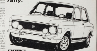
FIAT 128 RALLY 1300

Ma è interessante avere i vantaggi di una automobile rally.