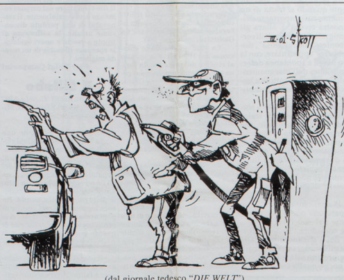
Nuovi, ingiustificabili aumenti del prezzo della benzina nell'Unione Europea danneggiano i cittadini e moltiplicano i profitti delle società petrolifere