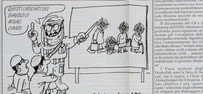
(dal giornale tedesco "DIE WELT")

Questi crociati del diavolo? Minac? Giorno?