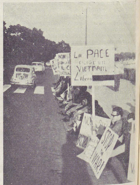
A Napoli, di fronte all'Ambasciata americana, decine di giovani del G. A. N. e del C. N. D. dimostrano per la fine della guerra nel Vietnam.

La polizia è intervenuta a far ritirare gli ultimi due cartelli; i dimostranti, pur protestando, hanno aderito alla cosa per non compromettere lo svolgimento della manifestazione.