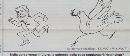
Nella corsa verso il futuro, la colomba della pace raggiungerà Netanyahu?

La Bicamerale avrà tempo sino al 30 giugno 1997 per trasmettere alla Camera uno o più progetti di legge di riforma della Costituzione nella sua seconda parte, cioè della forma di governo, del sistema elettorale, del bicameralismo, delle garanzie, ecc. I progetti trasmessi alla Camera saranno da quest'approvazione approvati o respinti.