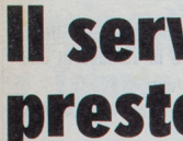
Il servizio militare di leva sarà ridotto a 12 mesi...