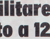
Il servizio militare di leva sarà ridotto a 12 mesi...

Il progetto di riforma Boldrin... « Per quanto riguarda il contratto di lavoro... »