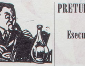
Il servizio militare di leva sarà ridotto a 12 mesi...

Il progetto di riforma Boldrin... « Per quanto riguarda il contratto di lavoro... »