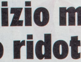
Il servizio militare di leva sarà ridotto a 12 mesi...

Il progetto di riforma Boldrin... « Per quanto riguarda il contratto di lavoro... »