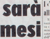
Il servizio militare di leva sarà ridotto a 12 mesi...