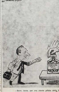
« Bene, bene, per ora niente pillola della libertà... »

L'azione della Cecoslovacchia, dopo l'uscita dell'Armata Rossa dagli altri Paesi alleati nel corso dell'estate, riguarda Polonia, Repubblica Democratica Tedesca, Ungheria, Romania, Bulgaria, Cecoslovacchia, Polonia. Il governo di Praga, che ha un passato di grande collaborazione con gli americani, è stato messo in discussione da un'azione sovietica che ha messo in discussione la sua politica di collaborazione con gli americani.