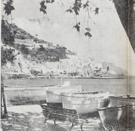
Palatina del Senato per Capri dal Parlamento di Anagni (Sforza)

Il rapporto dell'Unesco sottolinea l'importanza delle traduzioni per la diffusione della cultura e della conoscenza. In Italia, il settore delle traduzioni è in forte crescita, ma necessita di maggiore sostegno istituzionale e di iniziative per migliorare la qualità e la diffusione delle opere tradotte.