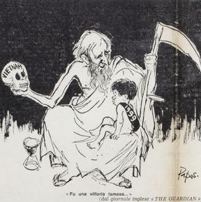
«Fu una vittoria lampo...»