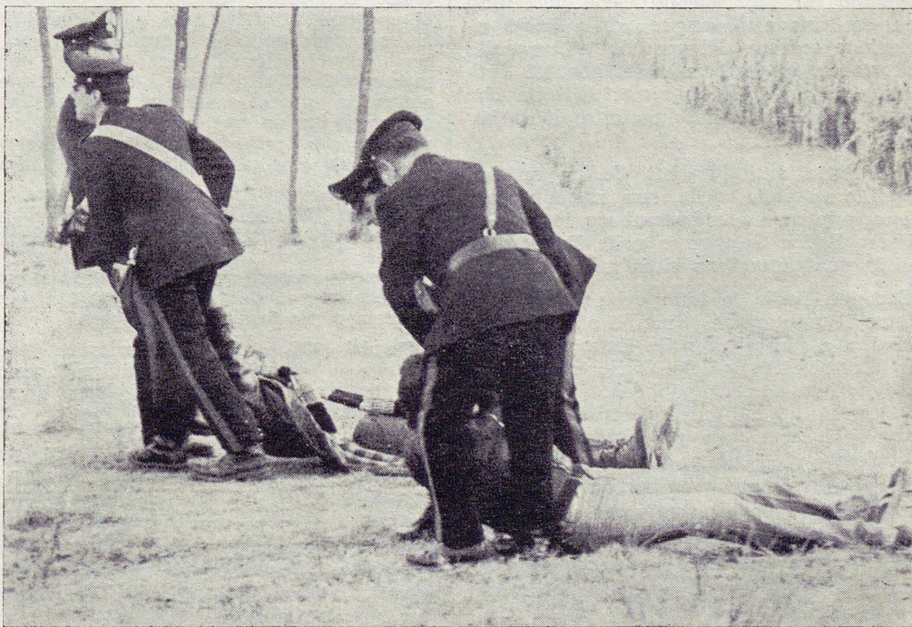
Una fase dello sgombero degli occupanti del poligono militare di Ca' delle Vallade.