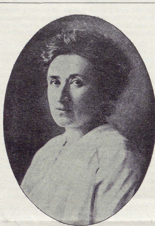
Rosa Luxemburg (nata a Zamosc, in Polonia il 5 marzo 1871 - morta a Berlino il 15 gennaio 1919).

Il militarismo è, per Rosa Luxemburg, una