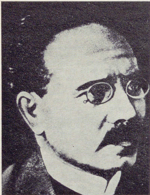
Karl Liebknecht (nato a Lipsia il 13 agosto 1871 - morto a Berlino il 15 gennaio 1919).

Il padre Wilhelm era stato, insieme con August Bebel, fondatore nel 1869 del partito socialdemocratico operaio tedesco e fu dal 1891 al 1900 direttore dell'organo di partito Vorwärts (Avanti!).