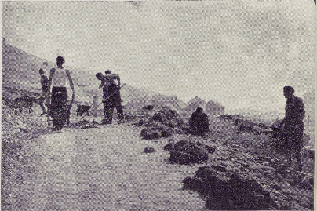
Una fase di lavoro al campo di Hospental.

del proprio animo; sublimazione infine di se stessi nel sentimento di dedizione ad un lavoro per un alto ideale, in questo caso di solidarietà umana e di pace. In queste esperienze, noi dobbiamo vedere il germe della costruzione di quello che William James ha indicato come il surrogato morale della guerra, l'assunzione cioè da parte della società civile di quei valori positivi assommata nella «virtù» militare volta ad effetti di distruzione, in una passione civica tesa direttamente al servizio della vita.